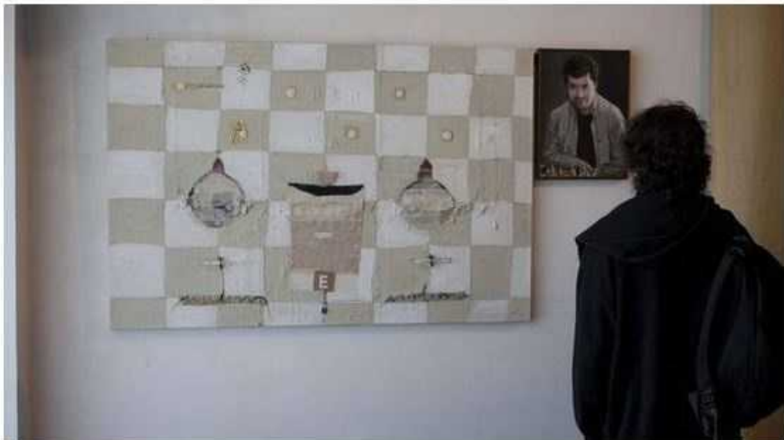
La obra ganadora del concurso de pintura temática de ExpoChess, firmada por Marta Ballvé.

UN REPORTAJE DE MIKEL GIL SOJO. FOTOGRAFÍA ALEX LARRETXI - Viernes, 24 de Julio de 2015