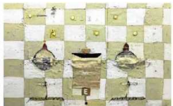
'Identidades cambiantes', de la pintora Marta Ballvé. :: EL CORREO

facética nacida en Barcelona en 1965, aunque desde hace 24 años vive en Sant Cugat del Vallés. Comenzó como diseñadora gráfica. Luego estudió Bellas Artes en la Universidad Sant Jordi de Barcelona, donde en 1995 se licenció en la especialidad de pintura. Más tarde descubrió la escultura. Expochess Vitoria-Gasteiz, que busca establecer un puente para acercar el ajedrez a todos los públicos, mantendrá hasta el 16 de agosto las diversas exposiciones en los salones del hotel vitoriano. Las muestras abarcan disciplinas como pintura, xilografías, filatelia o fotografía sobre el ajedrez, con las