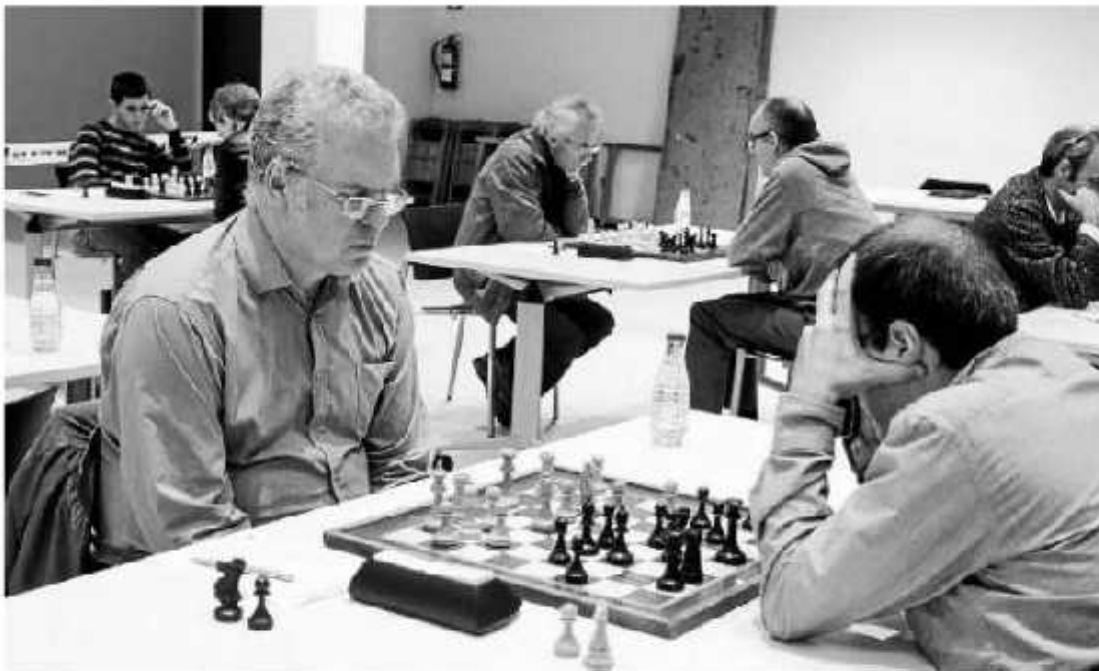
Un duelo entre la selección vasca y la escocesa de ajedrez en la anterior edición de ExpoChess celebrada en Azkoitia (Gipuzkoa).